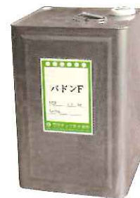
パドンF (A材) 缶