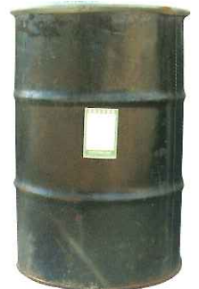
パドンF (A材) ドラム缶